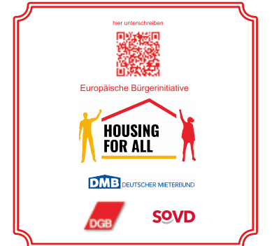
Grafik: EBI Wohnen für alle

Für die Initiative werben etwa Bierdeckel mit Logo und QR-Code.