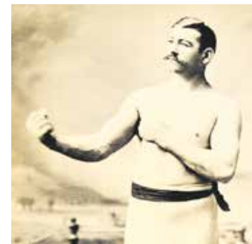
John L. Sullivan (1858–1918) erlebte eine herbe Niederlage.