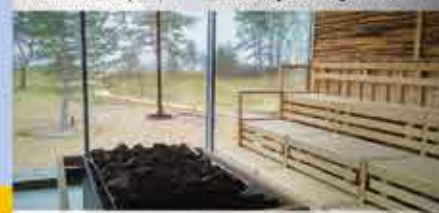
Sauna, 4+ Santé Royale Rügen Resort