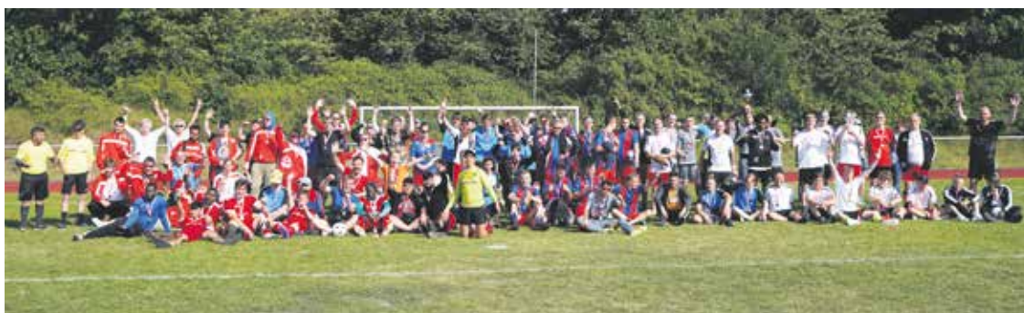
Gruppenfoto mit den Mannschaften der Fußballmeisterschaft der Berufsbildungswerke im Norden.