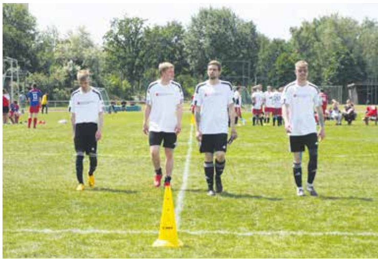
Spieler der Mannschaft der BBW Bremen auf dem Feld. Am Ende belegte das Team den zweiten Platz.

Herzlichen Dank gebührt allen beteiligten Abteilungen des BBW in Bremen (Holz, Gastronomie, Verkauf, IT, GaLa, Pflegedienst, Physiotherapie, Mensa, Haustechnik, Internat, Integration) für den fantastischen Zusammenhalt und die professionelle Arbeit.