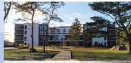
4+ Santé Royale Rügen Resort