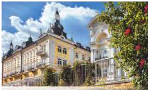
4+ Resort Reitenberger

Freizeit/Kur/Unterhaltung: Im Mittelpunkt des Resorts steht das Spa- und Medical-Wellnesszentrum mit Schwimmbecken (ca. 13,5 x 6 m, 32°C), Therapiebecken (ca. 4 x 6 m) und Whirlpool (beide 36°C). Hinzu kommt der großzügige Saunabereich mit finnischer Sauna mit Meerblick, Biosauna, Heilwaldsauna, Dampfsauna und Infrarotkabinen – ergänzt von einer Kamin-Lounge mit Blick auf die Ostsee.