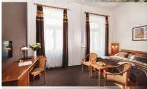
Zimmerbeispiel, 4+ Resort Reitenberger