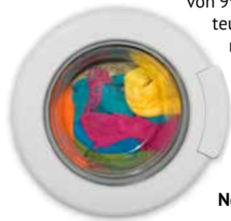
Neue Waschmaschine? – „Ansparen!“

teuren Maschine hatte sie unter anderem durch Gutscheine des Warenhauses beglichen. Die gesetzlichen Bestimmungen sähen für solche Fälle keinen Zuschuss vor (BSG, Az.: B 8 SO 1/21 R). wb/ele