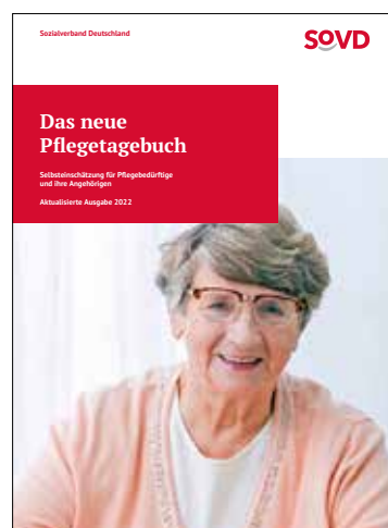
Auch das SoVD-Pflegetagebuch hilft, erhältlich auf der Webseite.