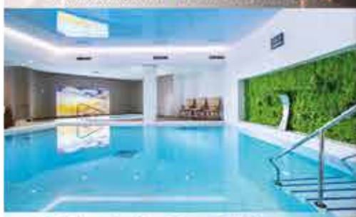
Schwimmbad, 4+ Resort Reitenberger