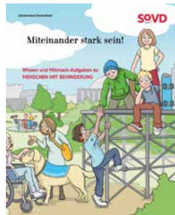
Das Cover der Broschüre.

Zum Thema Inklusion hat der SoVD außerdem Schulmaterial für den Einsatz im Unterricht konzipiert. Die Kinderbroschüre „Miteinander stark sein!“