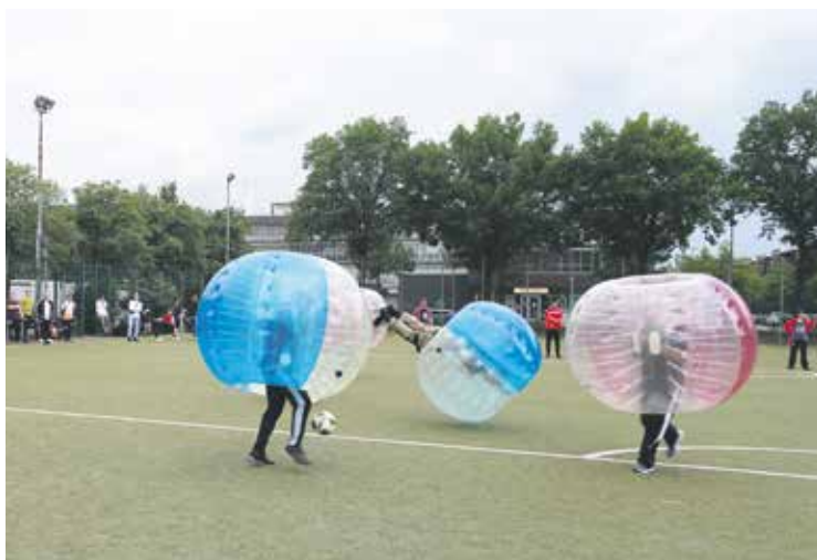
Voller Einsatz beim Bubble-Soccer: Am Freitag gab es ein buntes Rahmenprogramm vor dem Turnier.