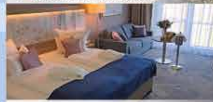
Zimmerbeispiel, 4+ Santé Royale Rügen Resort