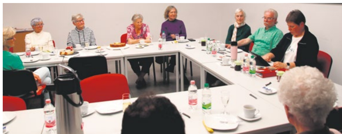
Die SoVD-Delegation konnte viele Fragen zu sozialrechtlichen Themen beantworten.

SoVD-Kreisverband Rostock/Bad Doberan besuchte Selbsthilfegruppe