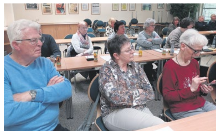
Die Anwesenden erfuhren wichtige Neuigkeiten aus dem Verband.

Nachdem für die Landesverbandstagung am 11. Mai der Delegiertenschlüssel festgelegt wurde, endete der Tag mit einem Mittagessen.