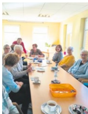
Die Zusammenkünfte stärken das Gemeinschaftsgefühl.

Wer Anschluss, Austausch und verlässliche Hilfe sucht, ist im SoVD genau richtig – neue Mitglieder sind jederzeit herzlich willkommen. Kontakt: Jugendhaus Röbel, Predigerstraße 12, Tel.: 039931/12 96 17.